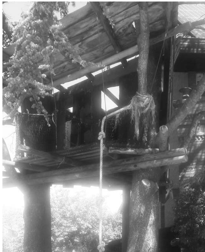
BOOMHUT IN DRIEMOND

werden geweren gemaakt, waardoor men al blazend, van papier gedraaide pijltjes, schoot. Je zag meisjes die met omhooggetrokken touw op blikjes liepen, als op stelten. Ook kon je met diezelfde blikjes een soort walkietalkie maken met een strakgespannen draad die er twee verbond.