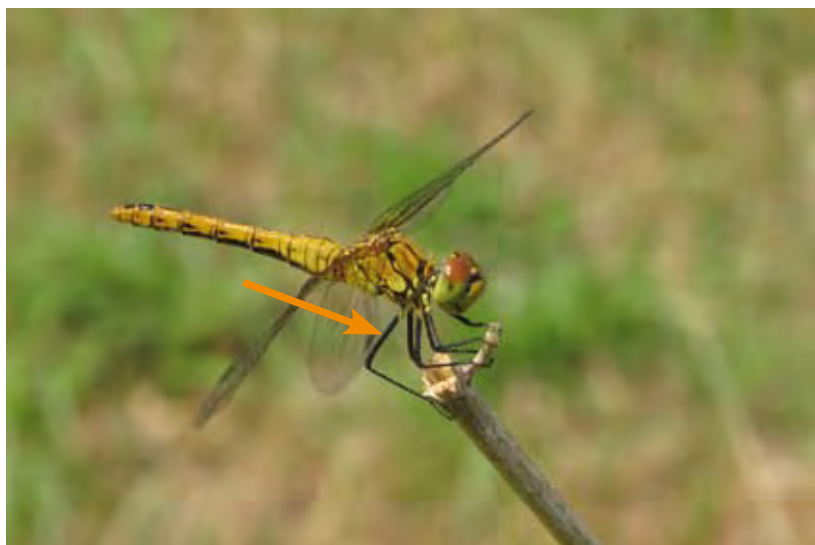
De bloedrode heidelibel is te herkennen aan de zwarte poten, zonder gele lengtestrepen. Vrouwtjes zijn overwegend geel gekleurd.

Heidelibellen zijn kleine, gedrongen 'echte' libellen (dus geen juffers), die vaak zittend in de vegetatie of op de grond te vinden zijn, ook ver van het water. Ze vliegen vaak voor je op als je door een grasland of heideveld loopt. Volwassen en dus uitgekleurde mannetjes van de meeste soorten hebben een rood achterlijf, vrouwtjes en jonge mannetjes zijn meestal geel, oranje of bruin. Heidelibellen hebben een min of meer rolrond achterlijf, dat dus niet duidelijk is afgeplat zoals bijvoorbeeld bij de vuurlibel, viervlek en oeverlibellen. In Nederland komen negen soorten heidelibellen voor, maar slechts vier daarvan zijn algemeen: zwarte heidelibel, bloedrode heidelibel, bruinrode heidelibel en steenrode heidelibel. We concentreren ons nu vooral op deze soorten. Wie deze soorten goed in de vingers heeft, herkent op een mooie dag vanzelf eens een zeldzamere soort!