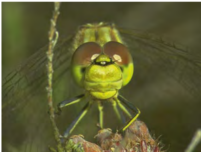
Ab H. Baas

Zuidelijke heidelibel: zeer zeldzame soort, die sterk op de bruinrode en steenrode heidelibel lijkt. De soort is bleker en geler, met minder zwart op de poten, borststuk en achterlijf. Zeer moeilijk te herkennen. ●